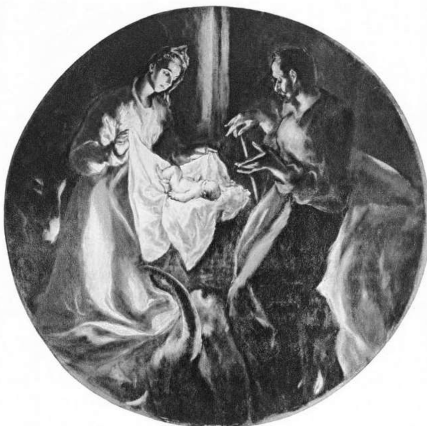
Ελ Γκρέκο - Η Γέννηση του Χριστού